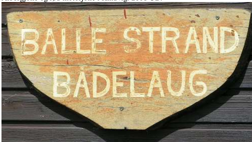
Balle Strand Havn. GPS N° 55° 2.089', E 12° 8.675'. Bedst at følge det sydlige løb.