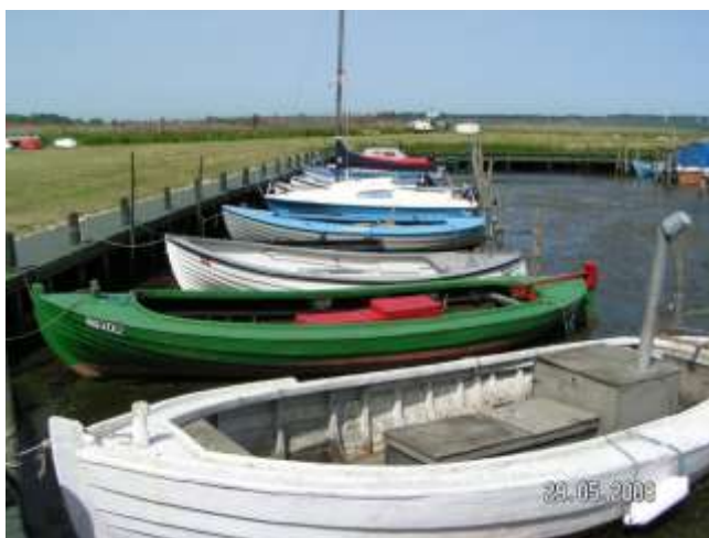
Den grønne jolle ND 300 sejlede som lodsjolle.

Oprikelig var denne havn udskibningssted for byen Mern højere oppe i land.