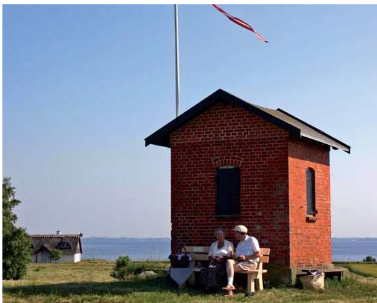
Lodshusets bagside på Nyord.

Kallehave Havn. På Sjællands SE-lige hjørne. Gl. havn er umiddelbart bag færgelejet. Marinaen er placeret mere mod W.