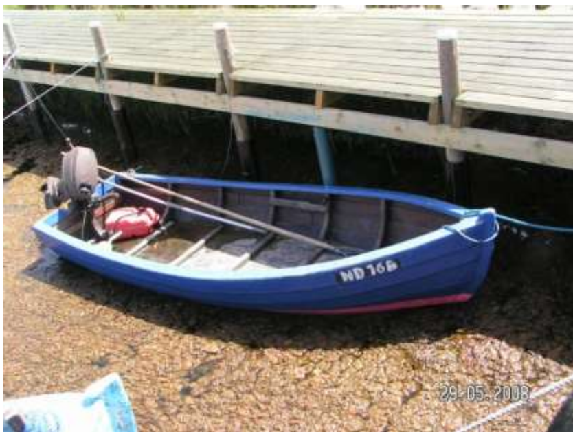
Lavtvands pram i Balle Strand Havn.