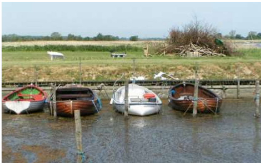
Tre - fire smukke bagdele i Kindvig.

Koordinaterne til havnene er placeret uden for, så man selv kan vurdere. Det er koordinater til i-nettets kort o. Danmark, de kan ikke sammenlignes med søkortets- længde og bredde.