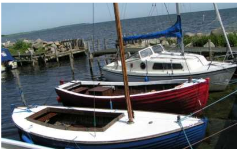
Ålborgjolle og rød motorjolle i Kindvig. 2008 UB.

Kindvig. Der er to havne: GPS 55° 3.047' 12° 7.825'. Nye Jollehavn mod N. Med stor, lang mole med badebro. Vejen op til byen hedder Lærkevej . Gammelhavn mod S. Der er slæbested - toilet og ferskvand. 55° 2.952', 12° 7.803'. Til byen ad Engvej . 5 km.