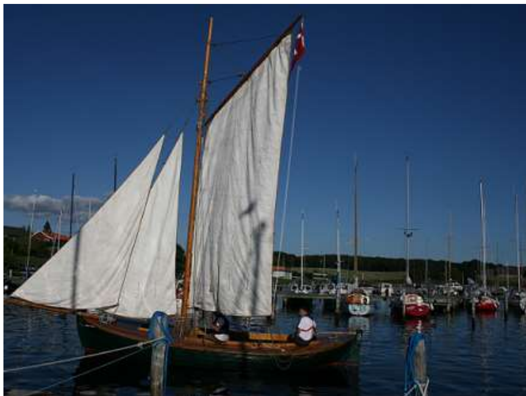
LODSEN af Raagø ankommer til hjemhavnen Vordingborg Sydhavn ved Valdemars Gåsetårn.