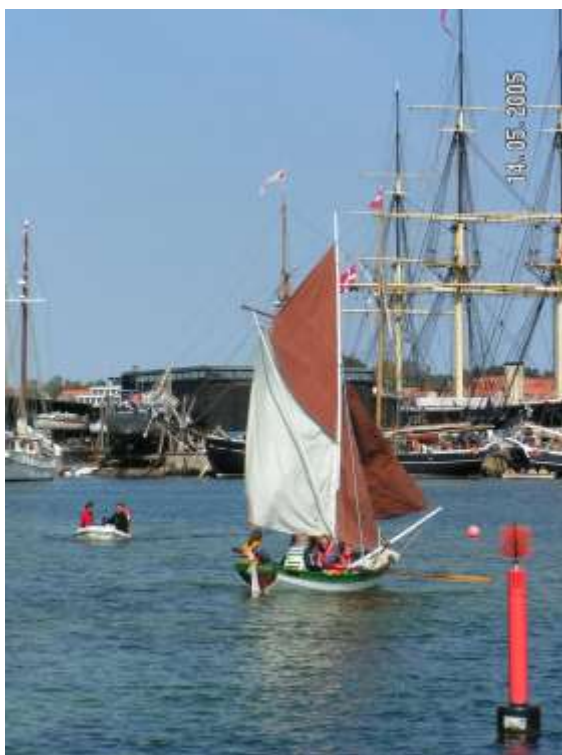
TS-Pinsestævne Ebeltoft 2005 "Thomas Højrup med familie."

Sidetal. Hvert kapitel har sit eget sidetal fra 1 og opefter. Med 'Kapitel nr, navn og sidetal', så man kan hitte ud a' det, hvis - -!