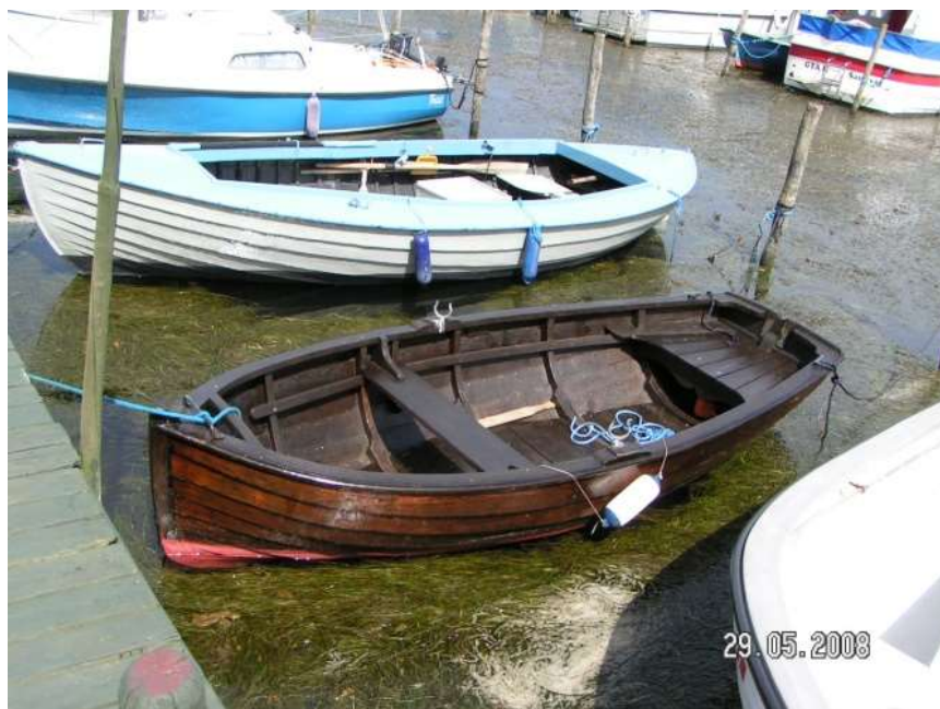
Velholdt slæbejolle i Sandvig.

Sandvig Havn. To bassiner, slæbested S for midtermolen. Her er levende historie - endnu. Mellem havnen og Sjællandsleden er der en primitiv Teltplads nr. N283.