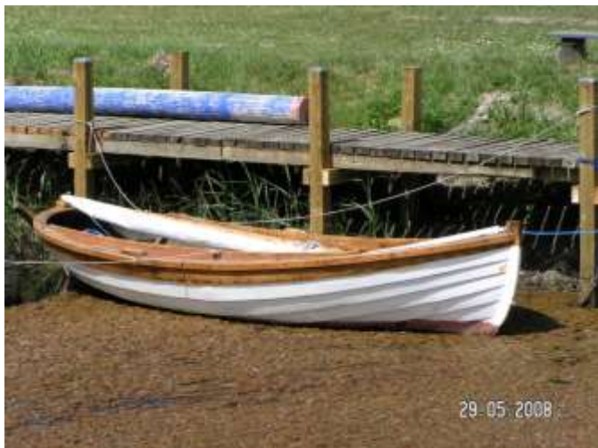
Lille, køn smakkejolle i Balle Strand.

God lille havn, lavvandet med fint klubhus. Her er ofte et par fiskere til stede.